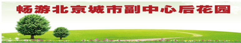
畅游北京城市副中心后花园